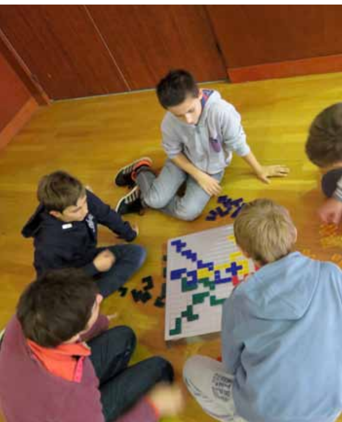
28 novembre. Fête du Jeu dans les écoles en partenariat avec la ville de Soisy sur Seine.