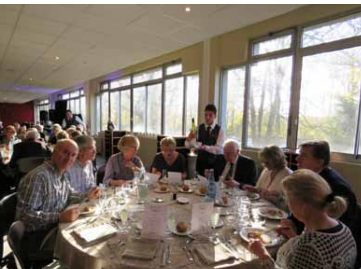
4 décembre. Repas des seniors au lycée hôtelier. Des animations ont permis de prolonger agréablement l'après-midi : danse, karaoké et performance étonnante d'un caricaturiste.