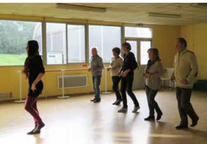
◀ 12 au 16 octobre. Semaine Bleue proposée par la mairie en partenariat avec l'AJE, le Centre de Loisirs, le club des Mulots de Soisy, les Randonneurs d'Étiolles, les Maisonnées Musicales et le Théâtre du Carré Magique. Au programme : chant, danse salsa, théâtre et atelier informatique.