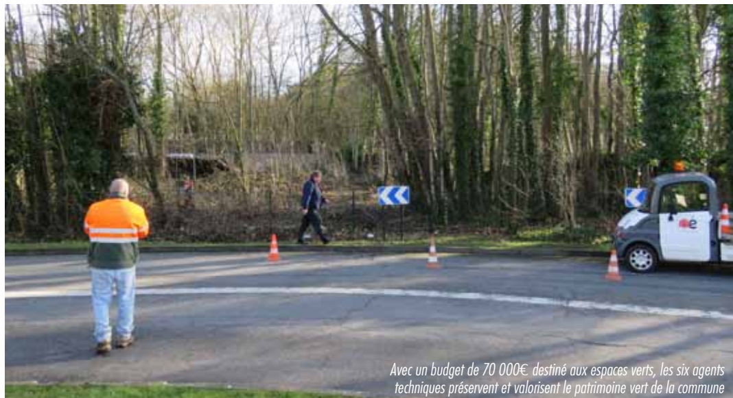
Avec un budget de 70 000€ destiné aux espaces verts, les six agents techniques préservent et valorisent le patrimoine vert de la commune

À Étioilles, l'environnement est un véritable atout entretenu avec attention par les agents des services techniques.