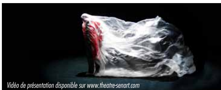
Vidéo de présentation disponible sur www.theatre-senart.com

Dans ce conte fantastique, la méduse et la baleine servent de guides aux créatures magiques. Apparition, disparition, effets spéciaux, jeux de lumières, vidéo, le