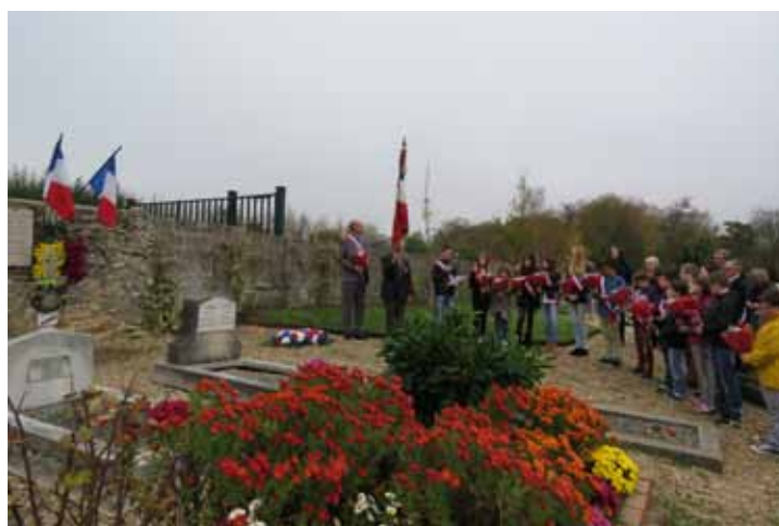
11 novembre. Cérémonie commémorative du 11 novembre 1918 avec la présence du Conseil municipal des Jeunes et du Conseil des Aînés. Une soixantaine de personnes étaient présentes.