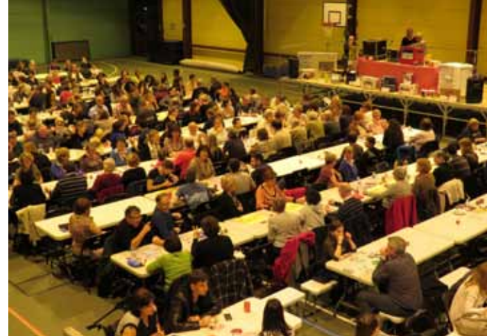
7 novembre. Près de 250 personnes ont participé au grand Loto organisé par le Comité d'Animation au gymnase des Hauldres.