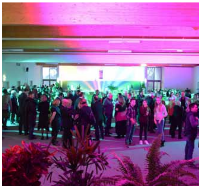
23 janvier 2016. Cérémonie des vœux du Maire à la Maison des Arts Martiaux. Ambiance conviviale dans un décor bucolique.