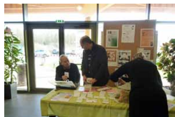
6 février 2016. Troc aux graines organisé par les Jardiniers d'Étiolles.