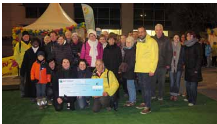
4 et 5 décembre. Pour le Téléthon 2015, le Centre de Loisirs a réalisé une grande fresque lumineuse. La marche vers le Génopôle avec les Randonneurs d'Étiolles s'est terminée par la remise d'un chèque de 2680€ reversés à l'AFM. Merci à toutes les associations participantes.