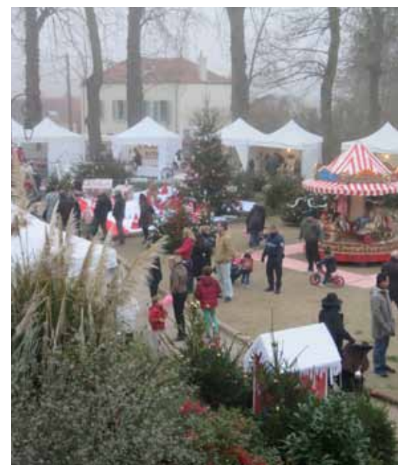
12 et 13 décembre. Marché de Noël au Petit Parc avec au programme chorale, carrousel, sculpture sur glace, balade en calèche et vente de produits artisanaux.