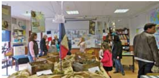
▲ 11 avril. Portes ouvertes au groupe scolaire Hélène Sandré. Les parents ont pu jardiner, chanter, écouter leurs enfants et voir le travail accompli sur le sujet de la Grande Guerre.