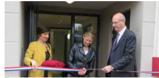
17 avril. Inauguration des 4 logements locatifs du 21, rue de Corbeil.