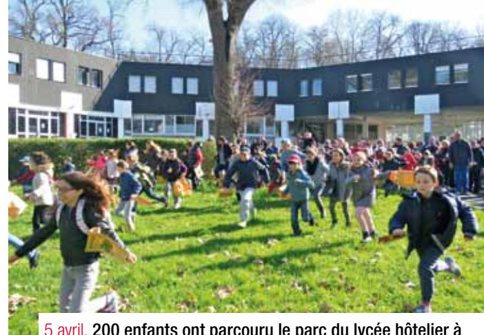
5 avril. 200 enfants ont parcouru le parc du lycée hôtelier à la recherche des 6000 chocolats cachés par les bénévoles du Comité d'Animation. Près de 600 "chasseurs" étaient présents lors de cette matinée très ensoleillée.