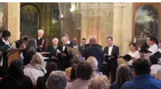
▲ 12 avril et 30 mai. Musique classique à l'Église, avec le groupe Trio de Vie et l'association humanitaire Musique en Œuvre.