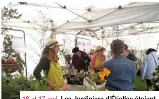
▲ 16 et 17 mai. Les Jardiniers d'Étiolles étaient présents à la fête des Jardins au Parc du Grand Veneur de Soisy-sur-Seine.