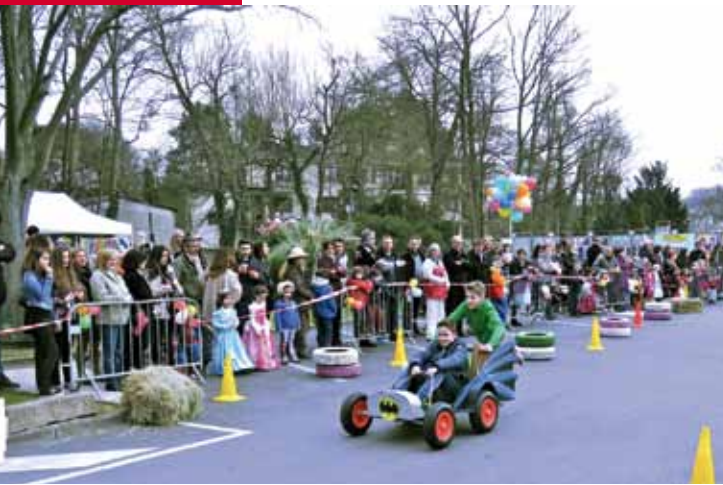
◀ 21 mars. Push car organisé par le service Enfance Jeunesse et Écoles. Les équipages ont rivalisé de créativité et de vélocité... La course faisait suite au carnaval proposé par la FCPE d'Étiolles.