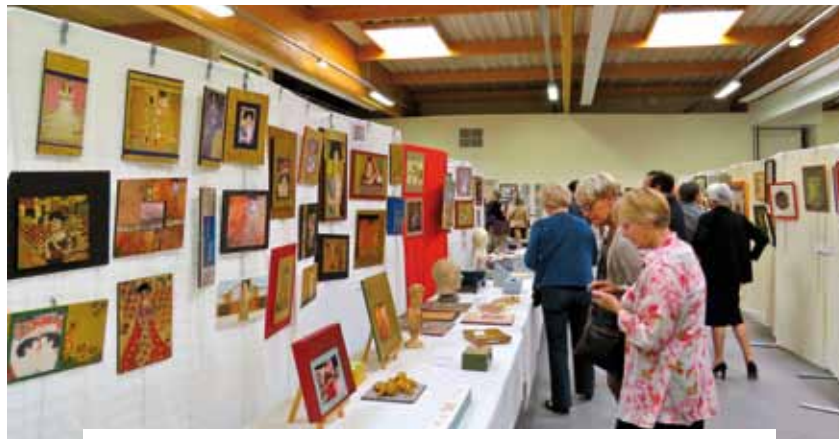
30 et 31 mai. Exposition encadrement et patine, organisée par l'Association Jeunesse d'Étiolles, à la Maison des Arts Martiaux Budokan. 400 œuvres étaient exposées.