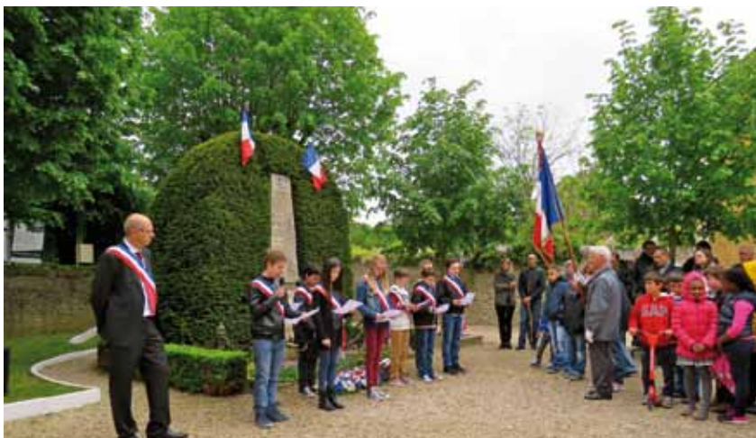
8 mai. Cérémonies commémoratives du 8 mai 1945. Le Conseil municipal des Jeunes, réuni pour la première fois depuis son élection, a participé à la cérémonie. L'occasion de lire un poème de Paul Éluard "Liberté". Une centaine de personnes étaient présentes.