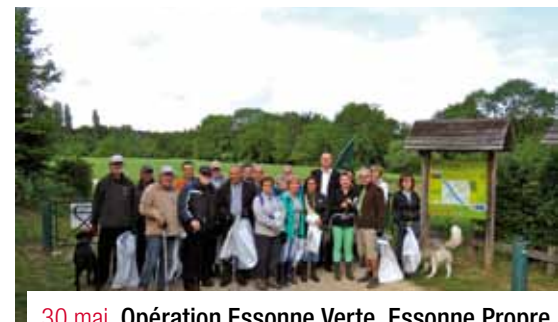
30 mai. Opération Essonne Verte, Essonne Propre pour nettoyer les berges de Seine. 25 participants ont collecté 400 kg de déchets.