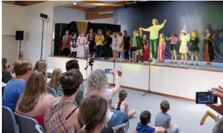
6 juin. Salle comble pour la représentation de l'atelier enfants à la Maison des Arts Martiaux Budokan.

Cette année par exemple, quatre «nouvelles recrues» ont été accueillies dans les groupes adultes