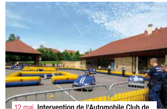
12 mai. Intervention de l'Automobile Club de l'Ouest à l'école élémentaire Hélène Sandré.