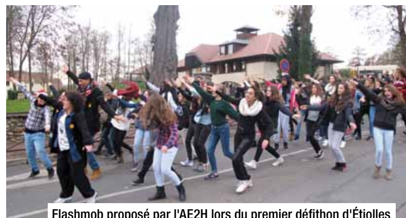
Flashmob proposé par l'AE2H lors du premier défiathon d'Étiolles

SERVICE VIE LOCALE 01 60 75 83 49 VIELOCALE@ETIOLLES.FR