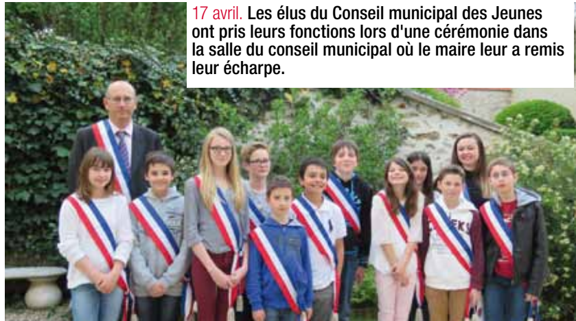
17 avril. Les élus du Conseil municipal des Jeunes ont pris leurs fonctions lors d'une cérémonie dans la salle du conseil municipal où le maire leur a remis leur écharpe.