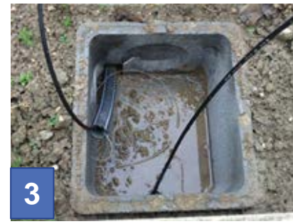
Vérification de la disponibilité des fourreaux sur votre propriété