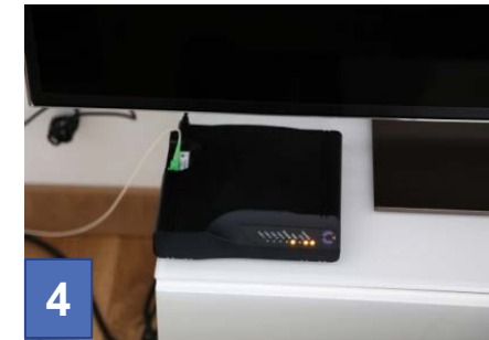
4 Installation de l'équipement Covage. Notre intervention se termine ici