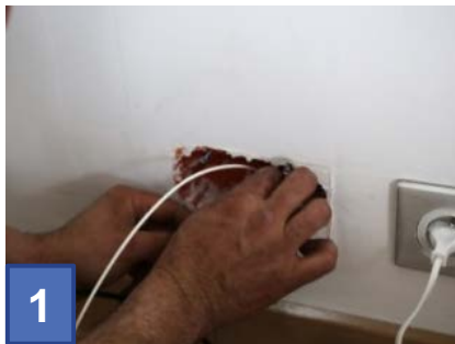
1 Passage de la fibre dans les gaines ou en apparent