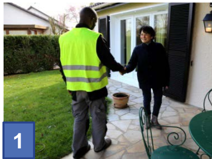
Arrivée à votre domicile