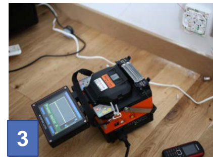
3 Soudure de la fibre pour la relier au réseau