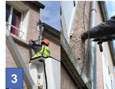
La fibre pénètre discrètement en façade

(1) En cas d'impossibilité d'utilisation de vos fourreaux, une intervention sera reprogrammée après réparation de ces derniers par vos soins.