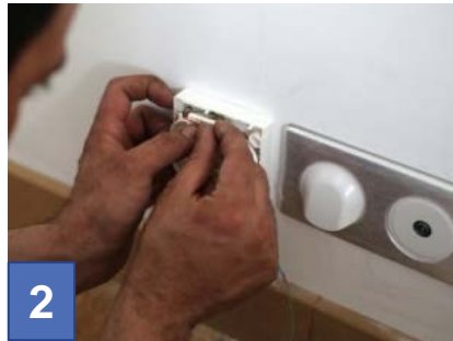
2 Installation de la Prise Terminale Optique (PTO) près du téléviseur principal