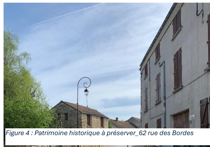
Figure 4 : Patrimoine historique à préserver_62 rue des Bordes