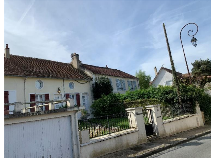
Figure 6 : Façade à préserver_32 rue des Bordes