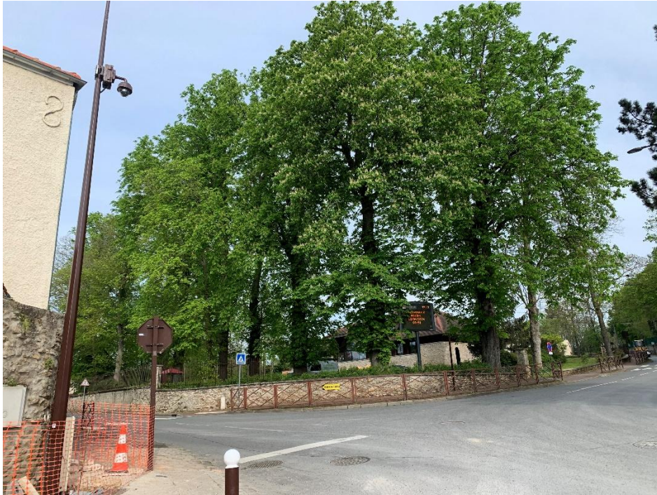
Figure 3 : 11Marronniers + 60 ans

Aire du restaurant scolaire rue du Vieux chemin de Paris