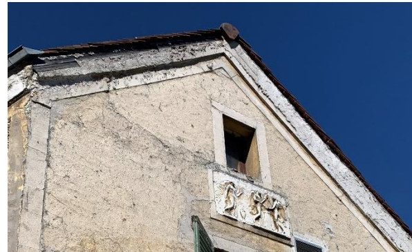
Figure17 : Fresque en haut relief à conserver