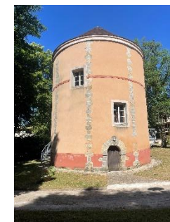
Figure 25 : Pigeonnier Bois du Cerf

Implanté au sein de la résidence des Bois du Cerf, ce pigeonnier représente un témoin du patrimoine rural traditionnel. De forme circulaire, en maçonnerie ancienne, il participe à l'identité historique du quartier. Bien que situé dans une propriété résidentielle, sa conservation est encouragée, ainsi qu'une éventuelle mise en valeur par des mesures architecturales ou informatives.