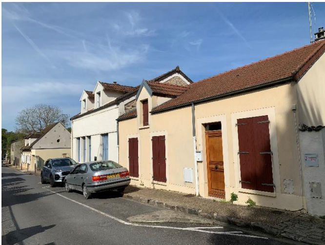
Figure 7 : Façade à préserver _25 rue des Bordes