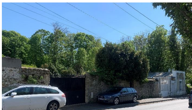
Figure 20 : Murs à préserver