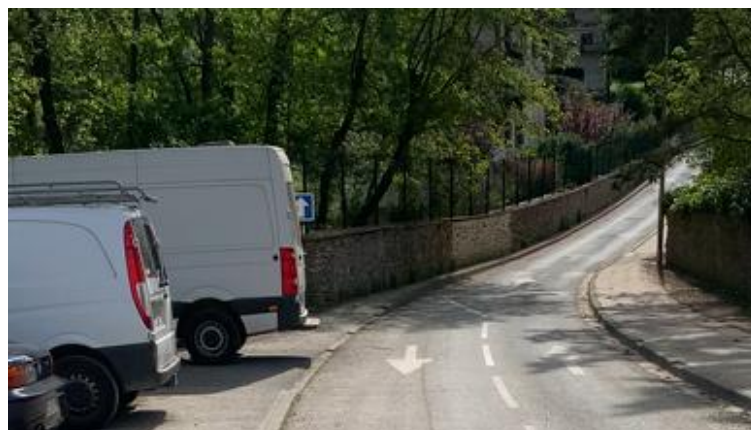
Figure 2 : Mur en meulière à préserver _Montagne de Goupigny