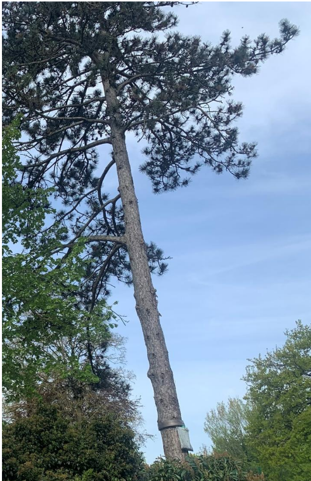
Figure 7 : Pin maritime

Groupe scolaire Hélène André rue du Vieux chemin de Paris