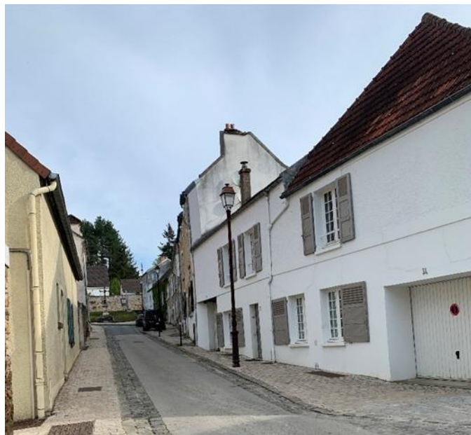
Grande rue en 2024

La Grande rue est une rue structurante de la Commune. Commerces, logements de religieux et bâtiment d'exploitation agricole y étaient localisés.