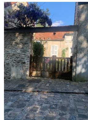
Figure 19 : Porche et mur à préserver