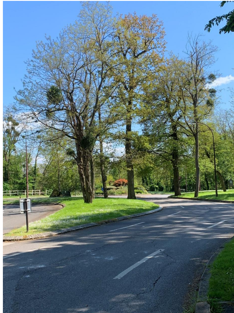
Figure 12 : Cépée d'acacias et deux chênes

Groupe scolaire Hélène André rue du Vieux chemin de Paris