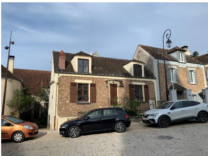
Figure 11 : Façade à conserver_ Place de l'Eglise