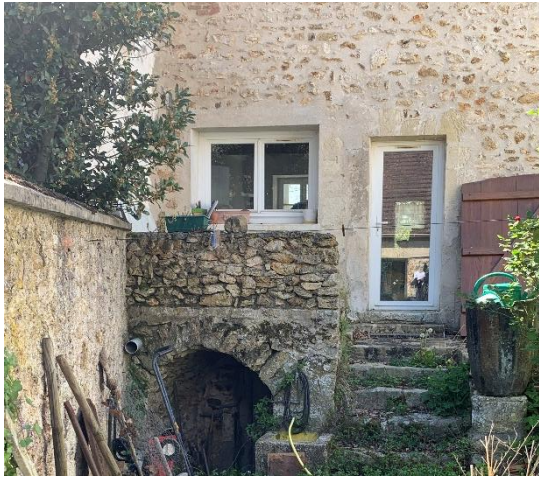
Figure 15: Façade à conserver