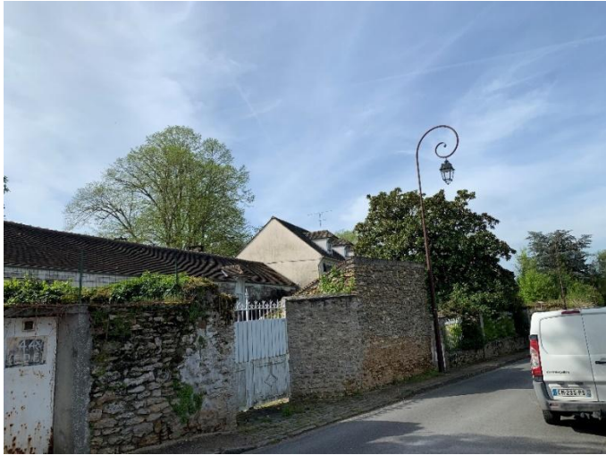
Figure 5 : Mur en meulière à préserver_ 40 rue des Bordes