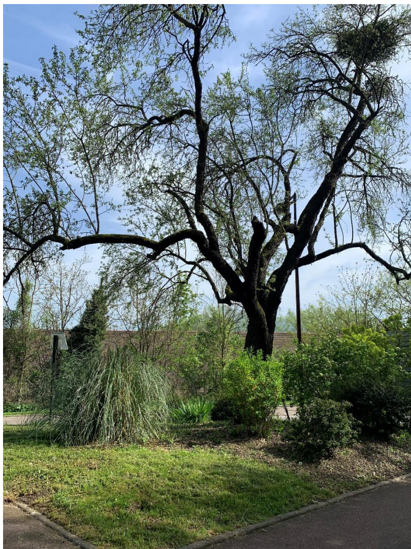
Figure 9 : Amandier