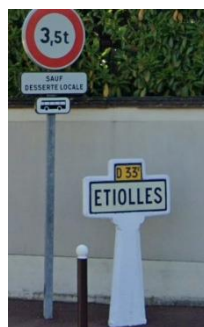
Figure 21 : Panneau de ville offert par Michelin à préserver

Entrée Sud de rue Collardeau via Av de la Fontaine aux Souliers