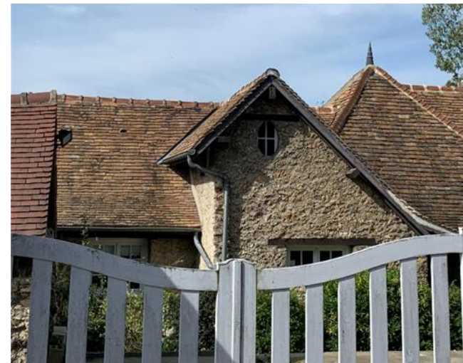
Figure 8 : Façade à préserver_6 Rue de Corbeil