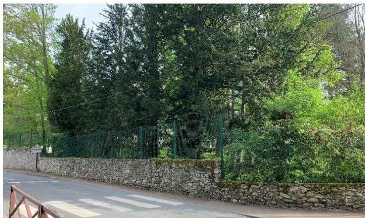
Figure 1 : Mur en meulière à préserver _Bois du Cerf