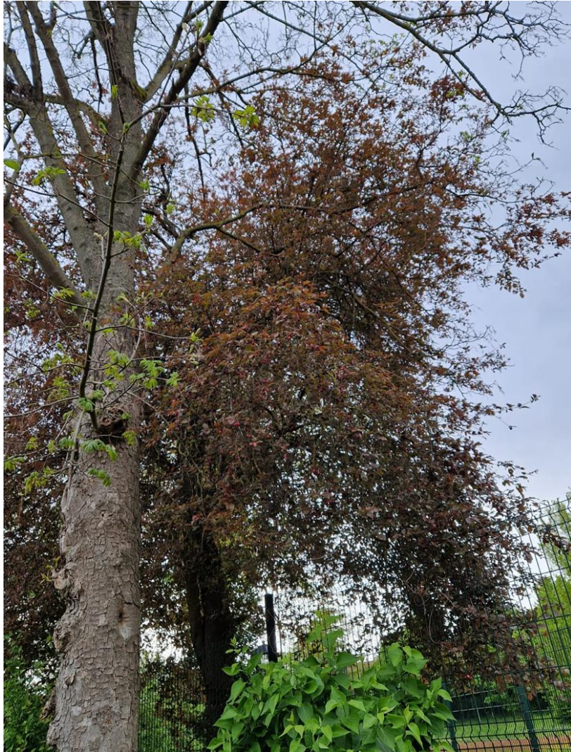
Figure 11: Prunus

Groupe scolaire Hélène André rue du Vieux chemin de Paris