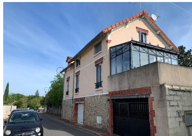
Figure 10 : Façade maison ancienne à conserver_27 Rue de Corbeil