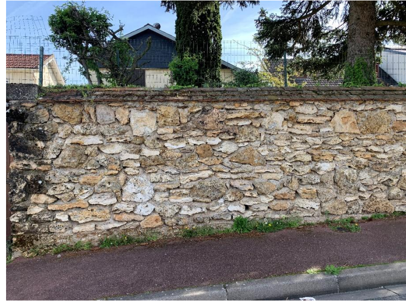
Figure 14 : 17 rue de Corbeil_Mur en meulière à conserver

Caractère de la ruelle et façades des maisons à conserver