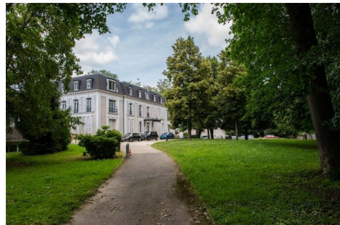
Figure 27 : Château du Lycée hôtelier

Occupant aujourd'hui le site du lycée hôtelier, ce château du XIXe siècle s'intègre dans un vaste parc arboré. Il constitue un témoignage de l'architecture résidentielle de prestige de l'époque, avec une mise en scène paysagère typique. Sa valeur tient autant à son architecture qu'à l'ensemble qu'il forme avec ses abords. La protection porte sur la conservation des volumes, des façades, et du parc.