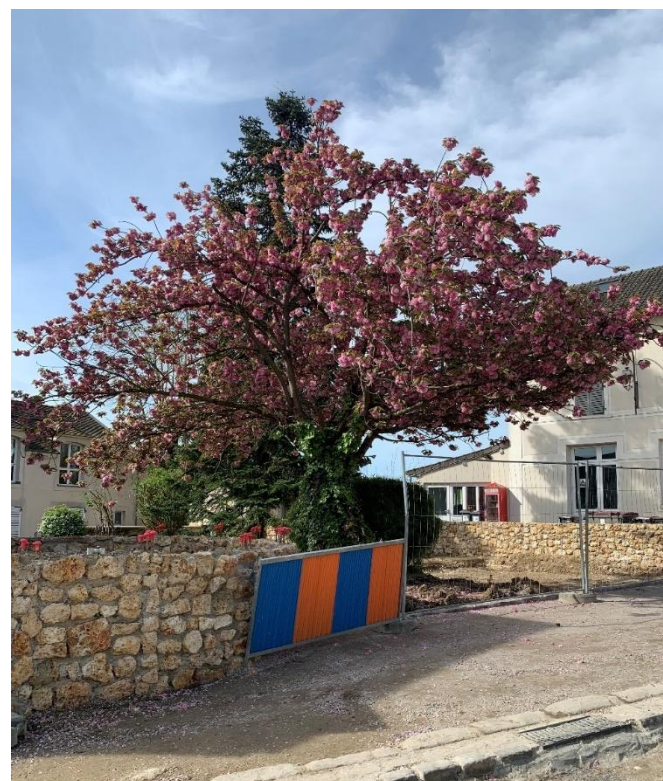
Figure 2 : Cerisier du Japon + 30 ans