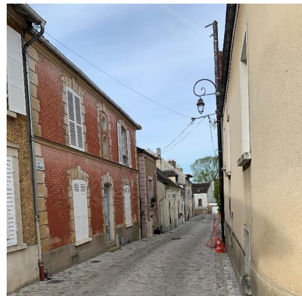
Figure 12 : Caractère à conserver_Rue de l'Eglise