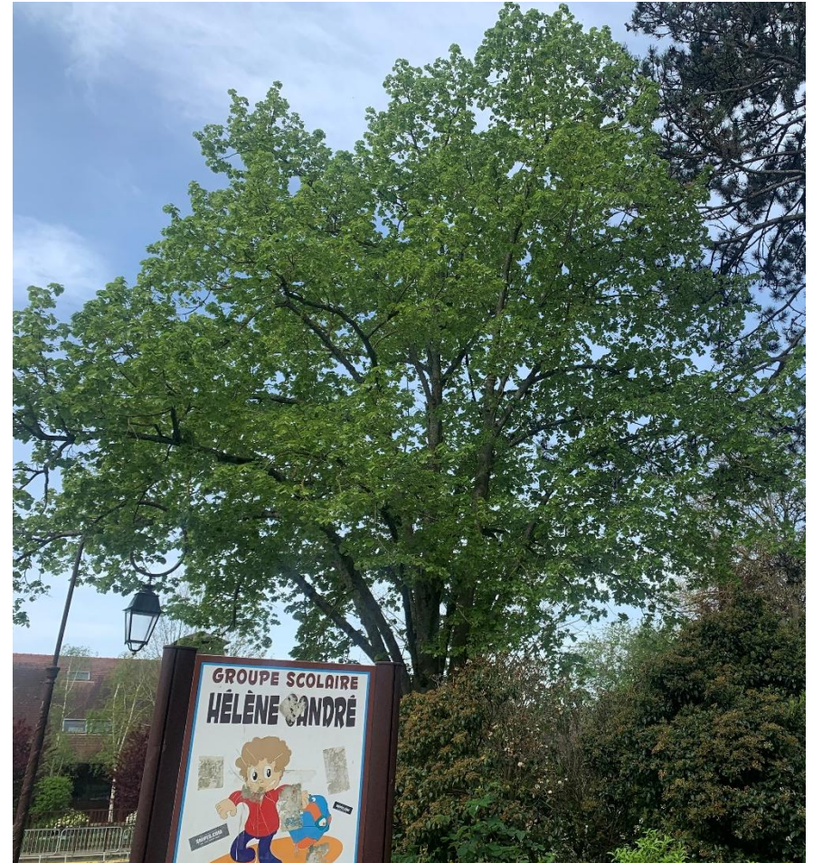
Figure 6 : Tilleul + 30 ans

Aire du restaurant scolaire rue du Vieux chemin de Paris