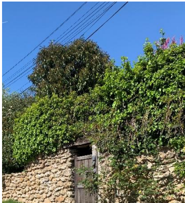
Figure17 : Mur en meulière à conserver