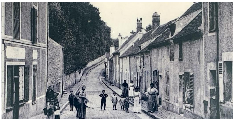
Grande rue années 60-70

La Grande rue est une rue structurante de la Commune. Commerces, logements de religieux et bâtiment d'exploitation agricole y étaient localisés.