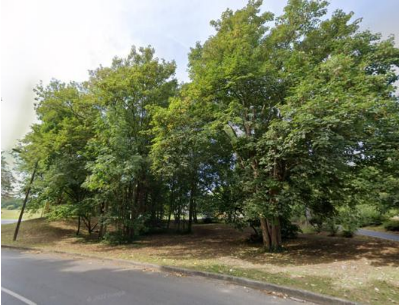
Figure 13 : Groupuscule d'arbres