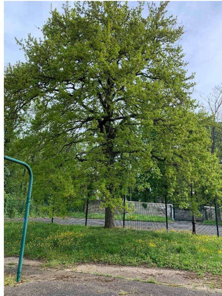
Figure 8 : Chêne pédonculé

Groupe scolaire Hélène André rue du Vieux chemin de Paris