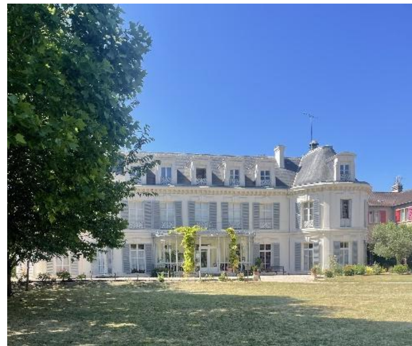
Figure 23 : Prieuré Saint Benoît

Ancien ensemble monastique d'une grande valeur historique, le Prieuré Saint-Benoît constitue un témoin précieux de l'histoire religieuse et rurale du territoire. Son architecture typique, ses dépendances encore en place et son intégration dans le paysage en font un élément structurant du patrimoine communal. Il est recommandé de préserver l'intégrité des bâtiments, ainsi que les percées visuelles depuis et vers le site.