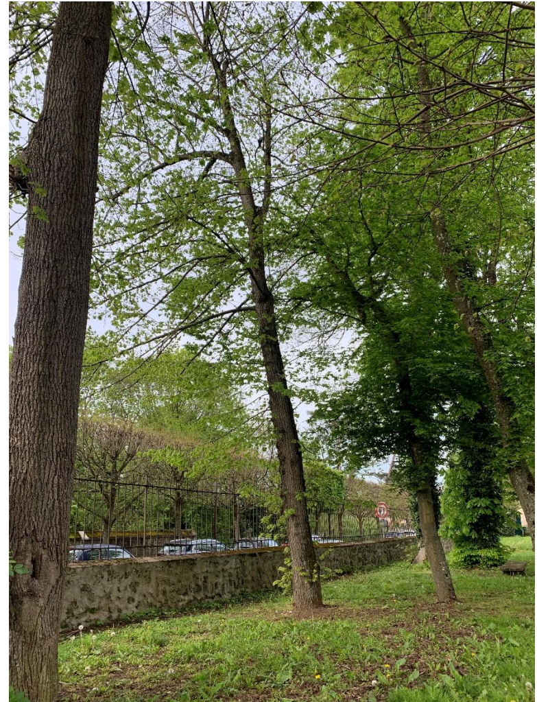
Figure 4 : 2 Ormes + 60 ans

Aire du restaurant scolaire rue du Vieux chemin de Paris