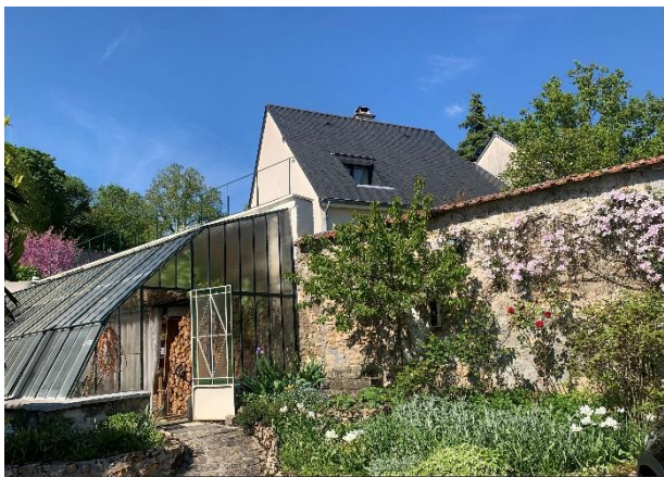
Figure 18 : Serre de l'ancien monastère