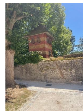
Figure 22 : Pigeonnier derrière pl de l'Eglise

Entrée Sud de rue Collardeau via Av de la Fontaine aux Souliers