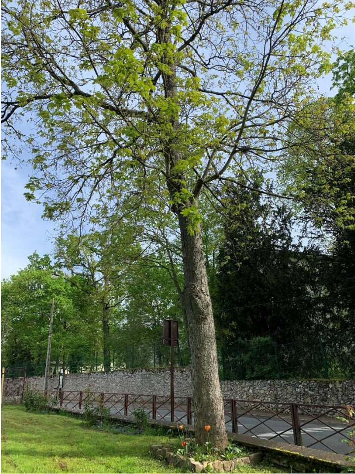
Figure 5 : Platane + 60 ans

Aire du restaurant scolaire rue du Vieux chemin de Paris