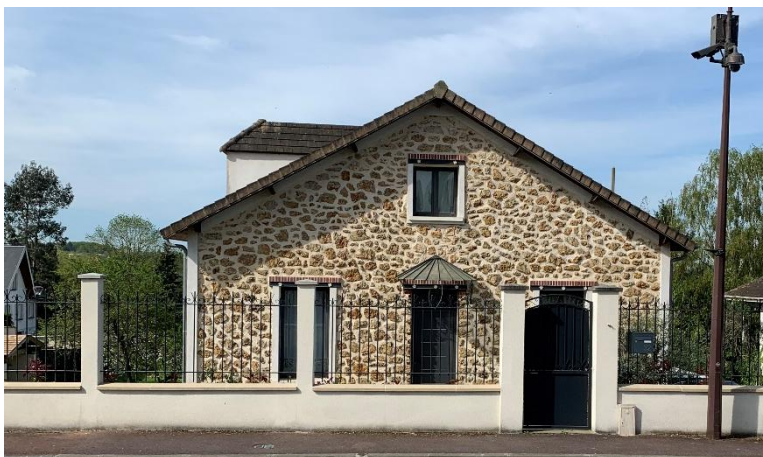
Figure 9 : Façade à conserver_32 Rue de Corbeil