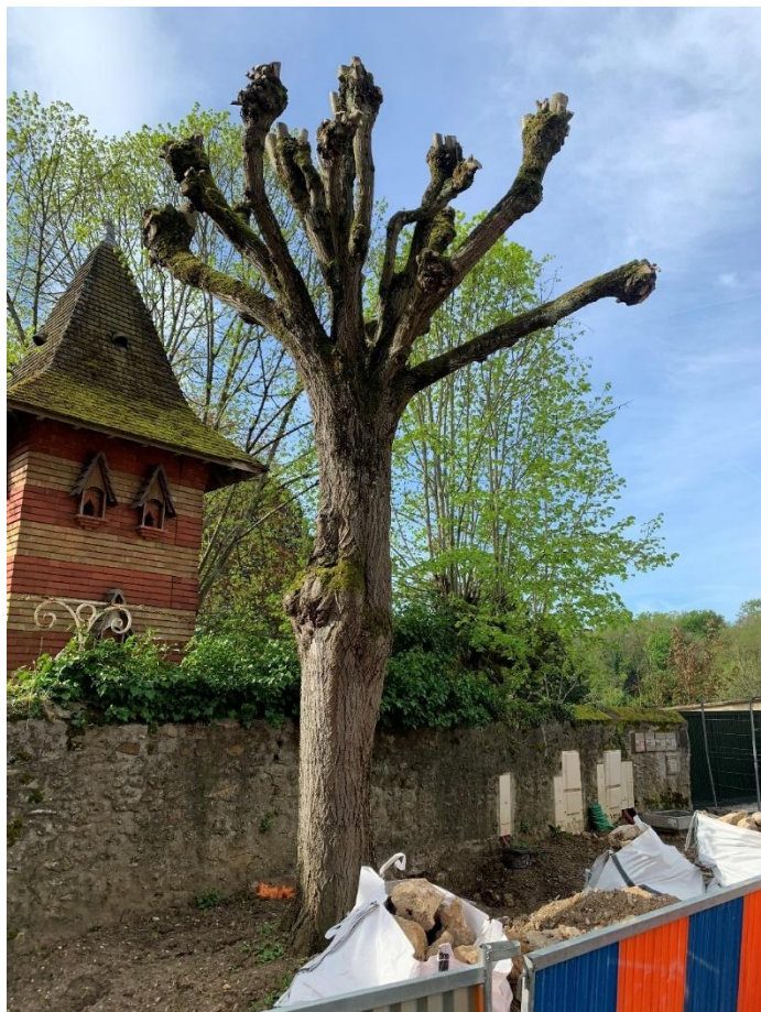
Figure 1 : Tilleul de + 18 ans