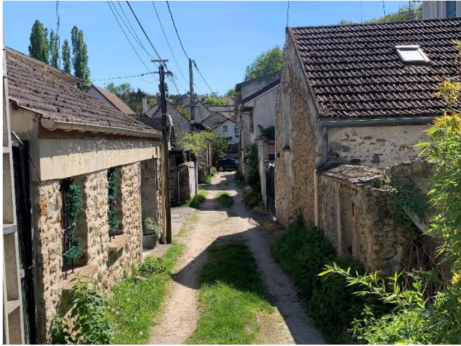
Figure 13 : Ruelle de la Grande Rue

Caractère de la ruelle et façades des maisons à conserver