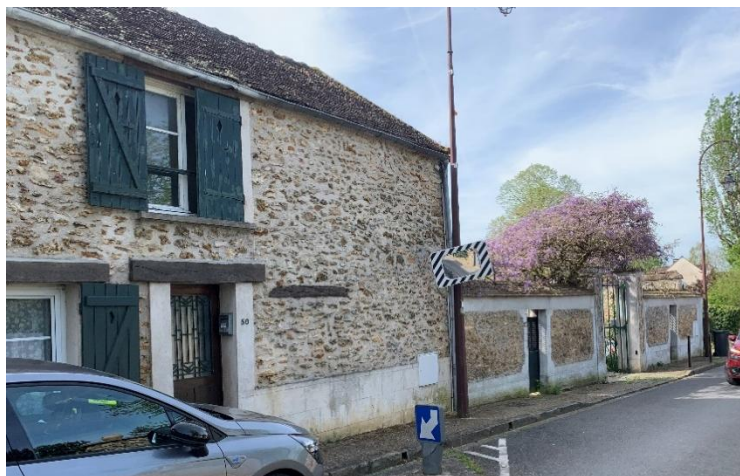
Figure 3 : Façade à préserver 48/50 rue des Bordes (48 : Ancienne maison de Marcelle Auclair)