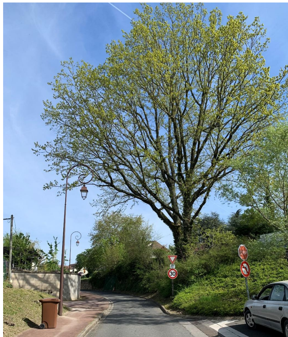
Figure 10 : Chêne