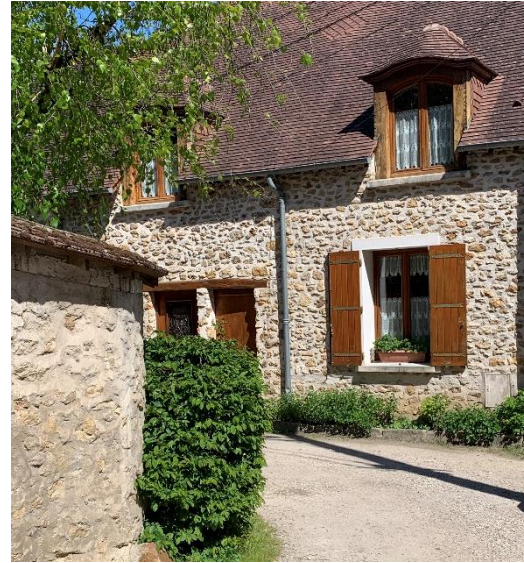
Figure 16 : Mur et façade à conserver